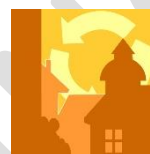
God bebyggd miljö

Inom målet God bebyggd miljö finns även en precisering för hållbar avfallshantering. Målet säger att "avfallshanteringen är effektiv för samhället, enkel att använda för konsumenterna och att avfallet förebyggs samtidigt som resurserna i det avfall som uppstår tas till vara i så hög grad som möjligt samt att avfallens påverkan på och risker för hälsa och miljö minimeras".