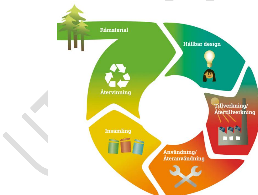
Figur 1. Schematisk bild över cirkulär ekonomi.

För att klara de ambitiösa klimat- och miljömål som beslutats på internationell, nationell, regional och lokal nivå måste avfallsmängderna minska. Det handlar bland annat om att köpa mindre, återbruka mera och förpacka produkter på ett bättre sätt. Det avfall som uppstår måste hanteras på ett miljömässigt bättre sätt genom materialåtervinning eller biologisk behandling.