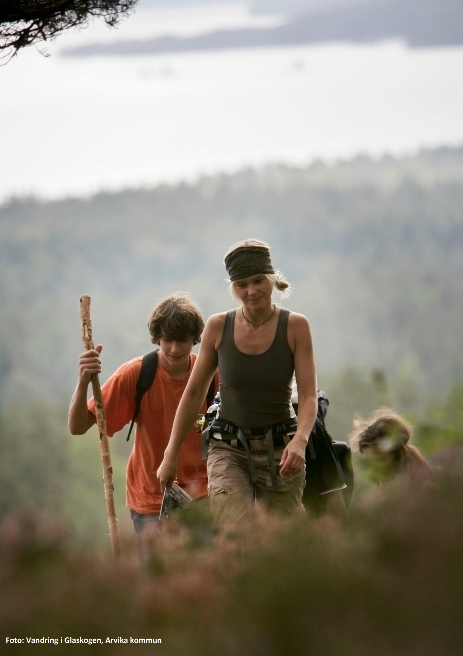
Vandring i Glaskogen, Arvika kommun