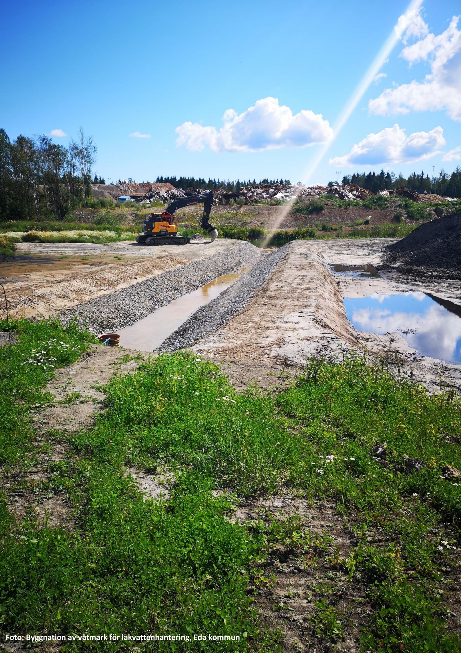
Foto: Byggnation av våtmark för lakvattenhantering, Eda kommun