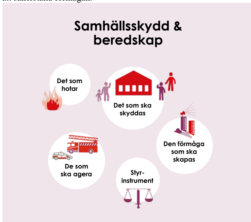
Figur 1. Illustration av samhällsskydd och beredskap som beskriver det som ska skyddas, vad som hotar, vem som ska agera, vilken förmåga vi ska skapa och styrinstrument

Samhällsskydd och beredskap kan beskrivas med bilden nedan, se figur 1. Vi ska skydda de nationella målen, ofta benämnt som samhällsviktiga verksamheter, mot det som hotar. För att lyckas med detta behöver vi skapa en förmåga hos de aktörer som ska agera. Det finns olika styrinstrument för att säkerställa förmågan.